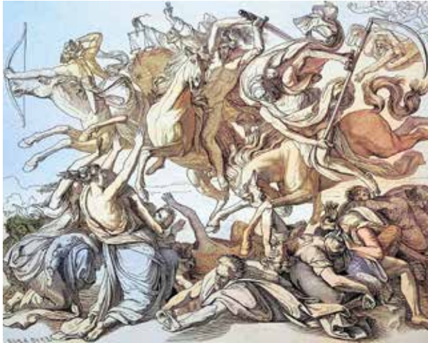
Bereits in der neutestamentarischen Offenbarung des Johannes verkünden vier apokalyptische Reiter die Ankunft des Jüngsten Gerichts.

der Halleysche Komet damals der Erde näherte, übertrafen sich Mahner jeglicher Couleur in panischen Vorhersagen. Der Erde stand laut ihnen wahlweise ein Aufprall, eine Verschiebung ihrer Achse, eine Pestepidemie oder eine Vergiftung der Atmosphäre durch Blausäure bevor. Die davon vollkommen verstörten Menschen versorgten sich daraufhin weltweit mit Gasmasken und „Kometenpillen“, dichteten ihre Wohnungen ab, leisteten eine letzte Abbitte im Beicht-