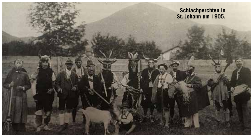
Schiachperchten in St. Johann um 1905.

früher ausschließlich beste- hend aus Männern. Sie zie- hen abscheuliche, groteske