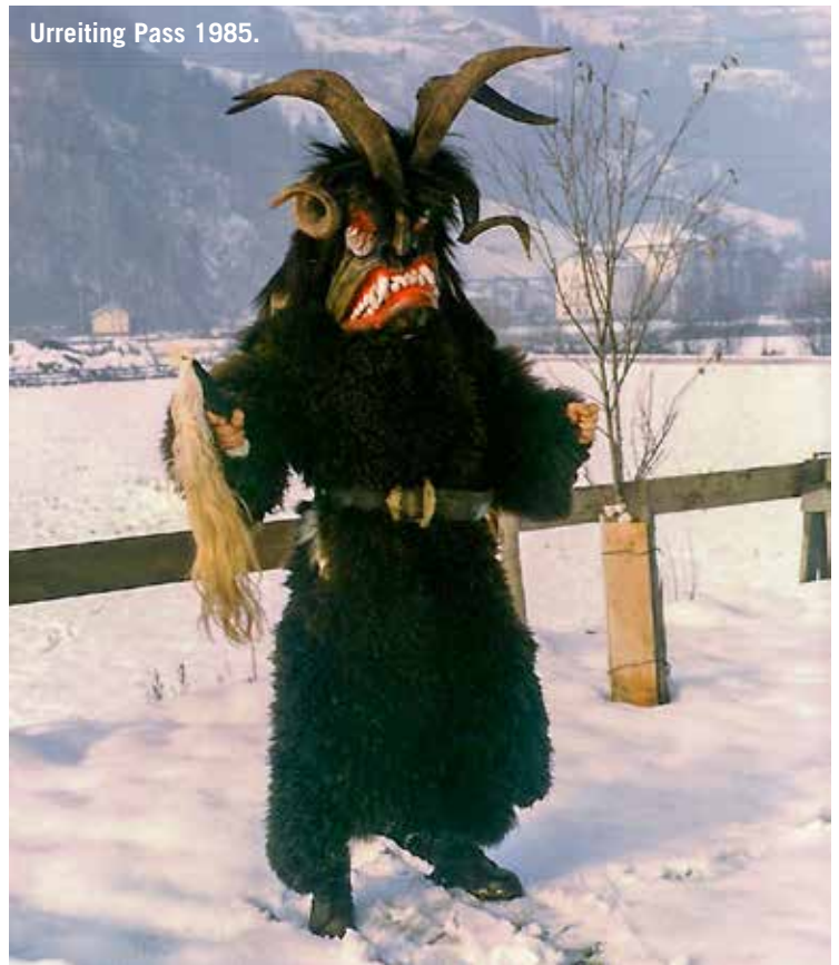
Urreiting Pass 1985.