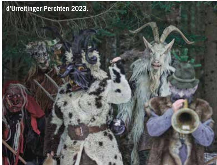
d'Urreiting Perchten 2023.

Aufzeichnungen, darunter findet sich die Howagoas, die Sau, der Tod, der Hahn, der Jäger, der Stier, Luzifer, die Hexe, die Schiachperchten und allen voran die Frau Percht, welche auch beim großen Pongauer Perchtenlauf als Sinnbild für gut und böse oder schön und schiach zu finden ist.