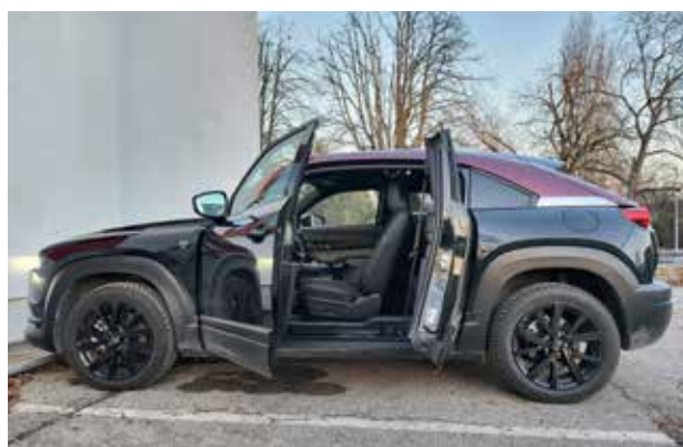
Keine B-Säule? Die gegenläufigen Türen sind im Alltag nicht immer praktisch.

zum Speicher für Elektrogeräte. Preislich gibt es den Plug-in ab 38.790 Euro. Die E-Variante startet ebenfalls bei diesem Preis. Für den Plug-in spricht sicher die Reichweite. Ob die E-Variante besser ist, entscheidet das Fahrprofil des Käufers und ob er eine Ladestation besitzt. ★