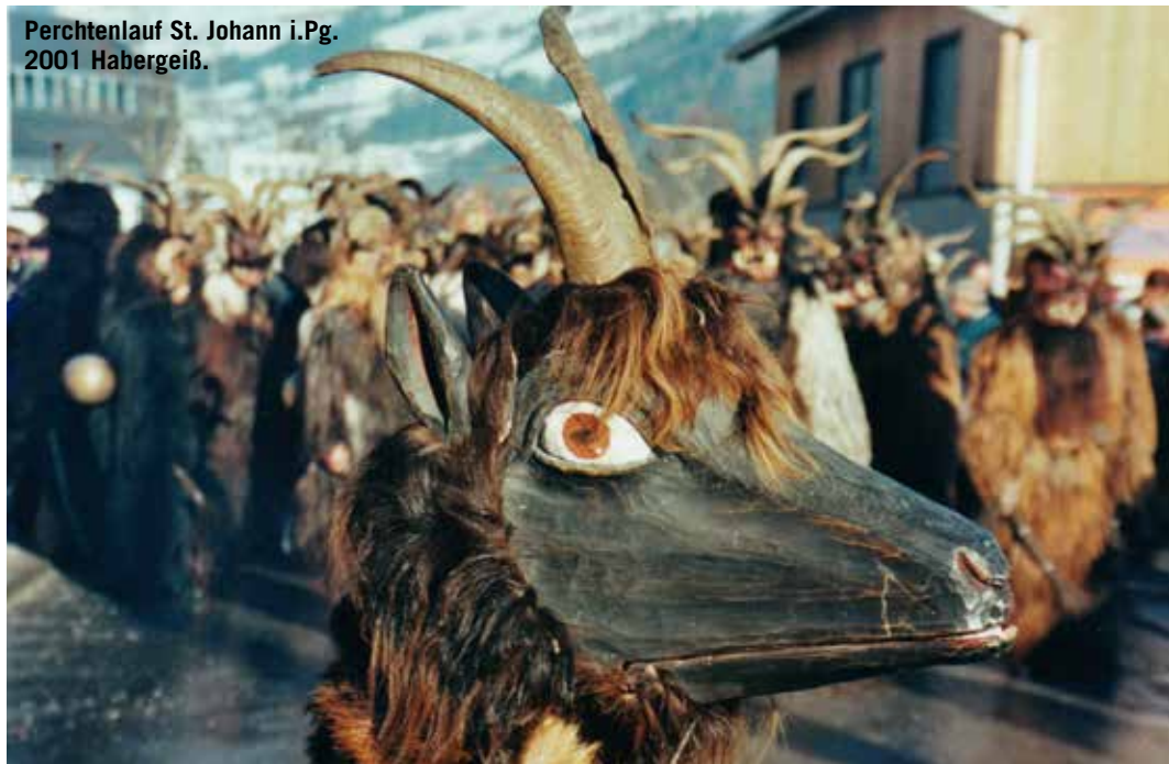
Perchtenlauf St. Johann i.Pg. 2001 Habergeiß.

auf Ackerbau und Viehzucht. Der keltische Jahreskreis orientierte sich an den Jahreszyklen und dem klimatischen Wechsel und spielte also eine wesentliche Rolle für das Überleben und gemeinschaftliche Zusammenleben an sich. Der Winter und die damit verbundene