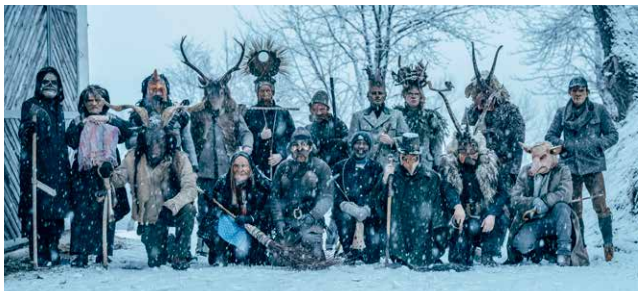
St. Veitner Perchten am 6. Januar 2024.

Fazit. Einer der für mich spannendsten Aspekte des Brauchs unserer Vorfahren war bei der Recherche die tiefe Verwurzelung mit der Natur und dem Kosmos. Themen wie Nachhaltigkeit und bewusster Umgang mit dem Leben scheinen hier eine große und überlebenswichtige Rolle zu spielen. Vielleicht ist die Rückkehr zu einem traditionelleren Bewusstsein zur Natur und