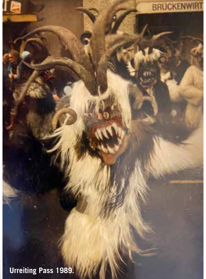
Urreiting Pass 1989.