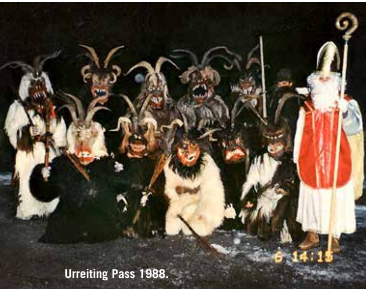
Urreiting Pass 1988.

welcher uns im Pongau von anderen Regionen unterscheidet. Der Perchtenlauf ist eine uralte Tradition die seit Jahrhunderten besteht. Nach einigen Recherchen wurde uns klar, dass die Perchten zwar jedes Jahr zu die Bauern in St. Johann besuchen aber der Ortsteil Urreiting seit vielen Jahren ausgelassen wurde. Darum entschlossen wir uns diese alte Tradition wieder aufleben zu lassen und waren im Jänner