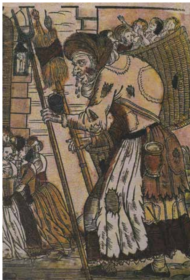
Buzen Percht 17. Jahrhundert.

setzt, jedoch wurden zu dieser Zeit, speziell in Nord und Mitteleuropa alle heidnischen Gebräuche untersagt. Der